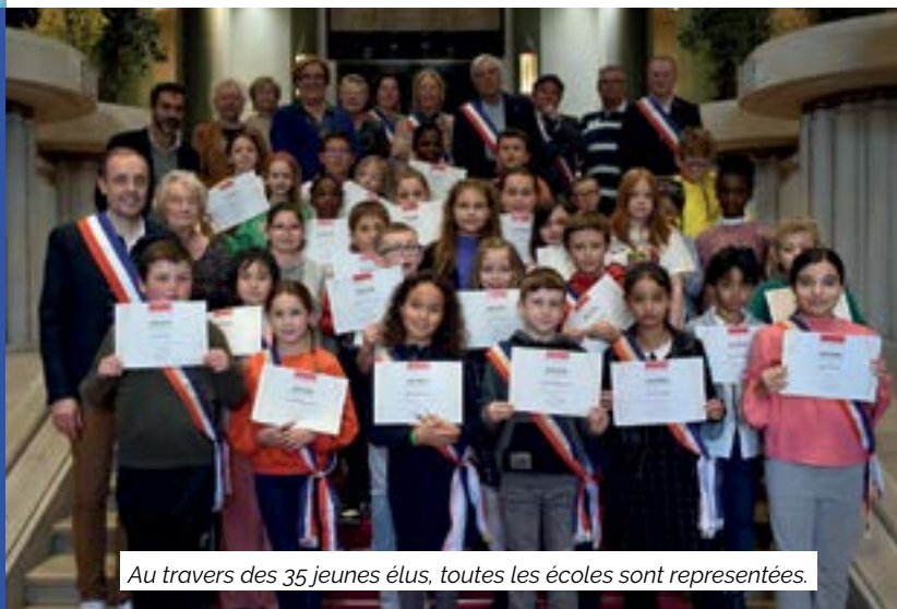
Au travers des 35 jeunes élus, toutes les écoles sont représentées.

Lors de la remise de ces ouvrages dans les classes, les 9 et 10 novembre, les élus n'ont pas manqué de les encourager pour la suite de leur parcours scolaire.