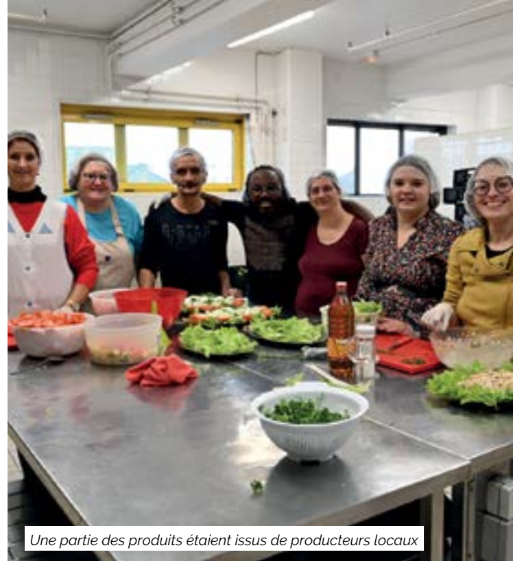
Une partie des produits étaient issus de producteurs locaux

Pour en témoigner, les ambassadeurs du pouvoir d'achat ont pris possession des cuisines avec leurs voisins d'Houdain pour confectionner, dans la bonne humeur, un menu qu'ils ont ensuite dégusté avec des seniors, accompagnés pour certains de leurs petits enfants, dans une démarche intergénérationnelle. Pendant le repas, les échanges ont bien évidemment porté sur les bonnes pratiques et les astuces pour consommer mieux, grâce aux supports fournis par les équipes du CCAS, présents à chaque table.